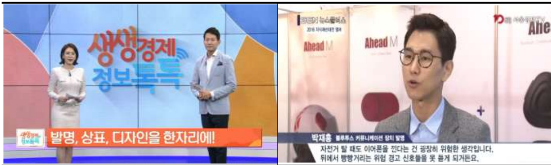
주요 매체 홍보 및 수상자 인터뷰(예시)