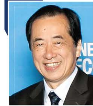
간 나오토 前 일본 총리