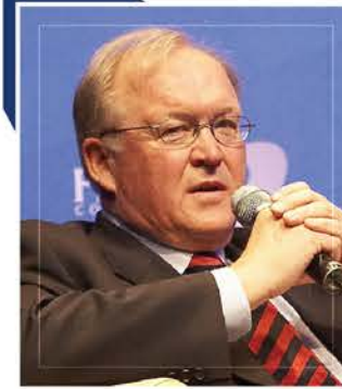
요란 페르손 前 스웨덴 총리