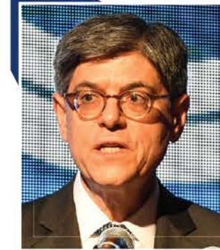
제이콥 루 前 미국 재무부 장관