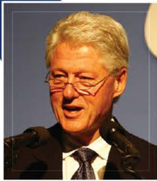
빌 클린턴 제42대 미국 대통령