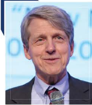
로버트 실러 2013년 노벨경제학상 수상자