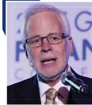
배리 아이켄그린 UC버클리대 교수