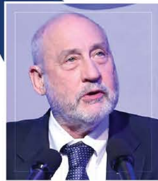
조지프 스티글리츠 2001년 노벨경제학상 수상자