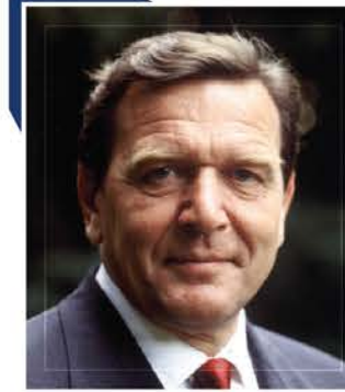
게르하르트 슈뢰더 前 독일 총리