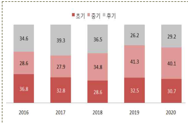
업력별 신규투자 금액