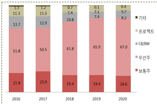
유형별 신규투자 금액