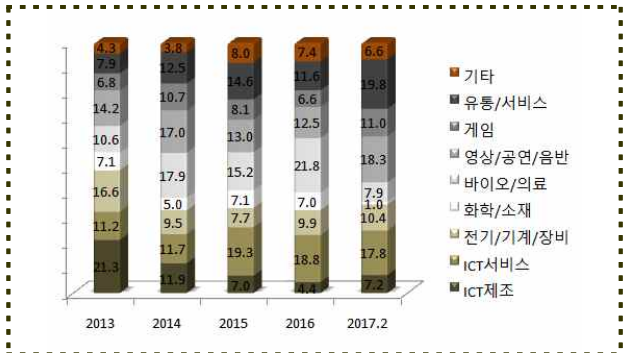
업종별 신규투자 금액